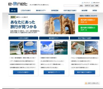
イー旅ネットのホームページ