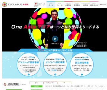
エボラブルアジアのホームページ